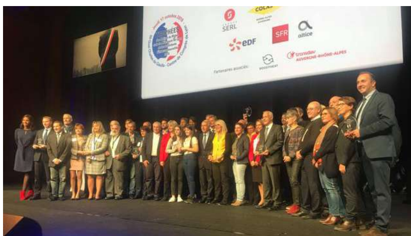
L'édition 2019 des Trophées des maires du Rhône.