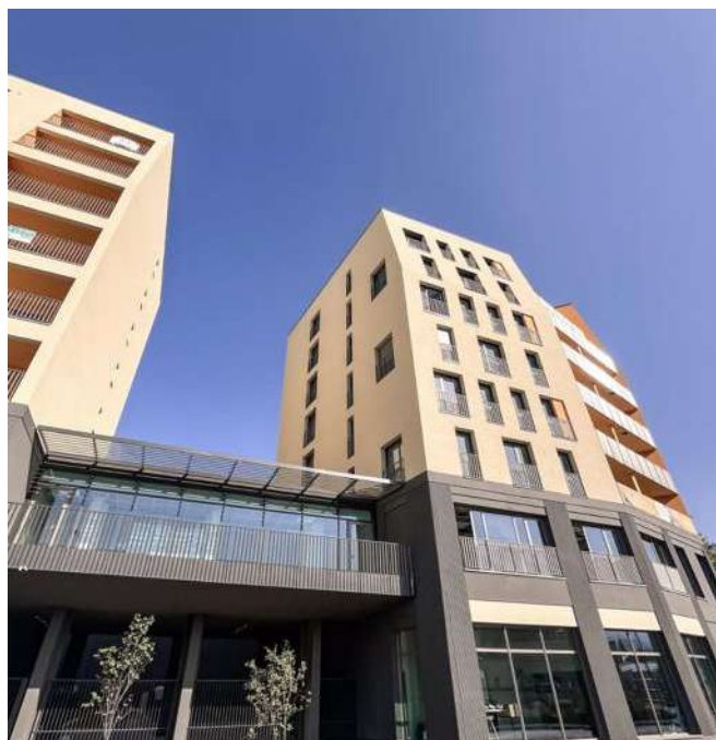
La résidence Green Rock à Saint-Martin-d'Hères (38), en co-promotion entre LP Promotion et Neocity. Photo LP Promotion

Avec Version Pierre, LP Promotion réaffirme sa volonté de s'inscrire dans une dynamique de développement durable, en transformant des espaces délaissés en zones vivantes et attractives, tout en respectant l'authenticité des bâtiments. Cette nouvelle filiale incarne notre vision pour l'avenir : un modèle de réhabilitation qui allie modernité et respect du patrimoine, et qui répond aux défis écologiques de notre époque. Nous sommes convaincus que Version Pierre jouera un rôle central dans le futur de l'urbanisme durable en France, en offrant des solutions qui conjuguent innovation, responsabilité environnementale et ancrage local. »