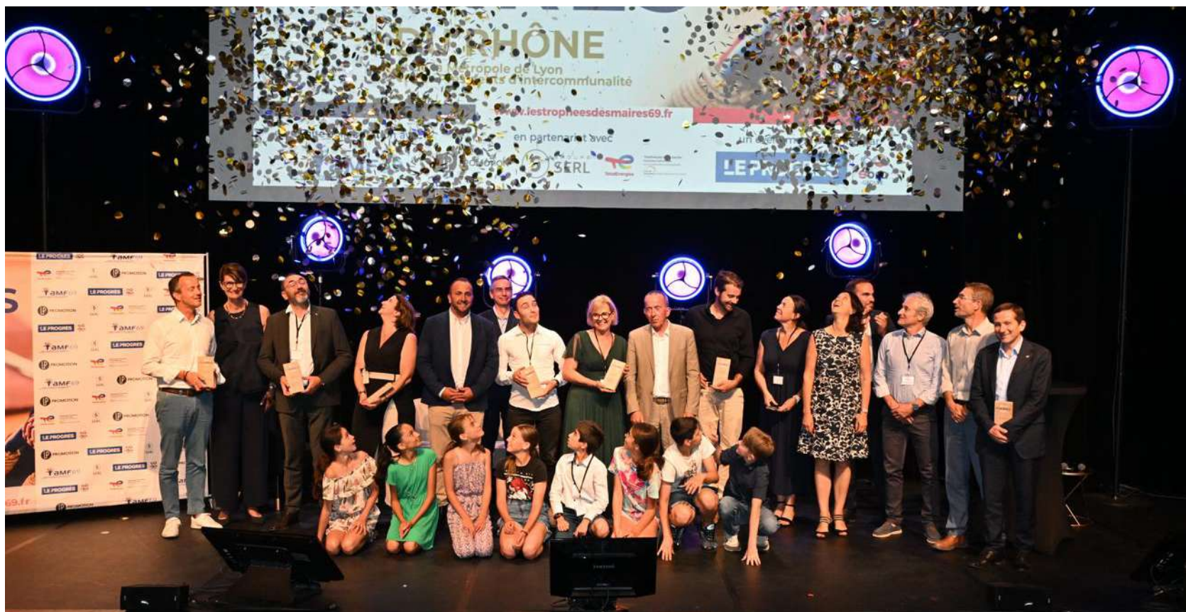
Les remettants et les lauréats réunis l'an dernier sur scène avec des enfants lors de l'édition 2023.