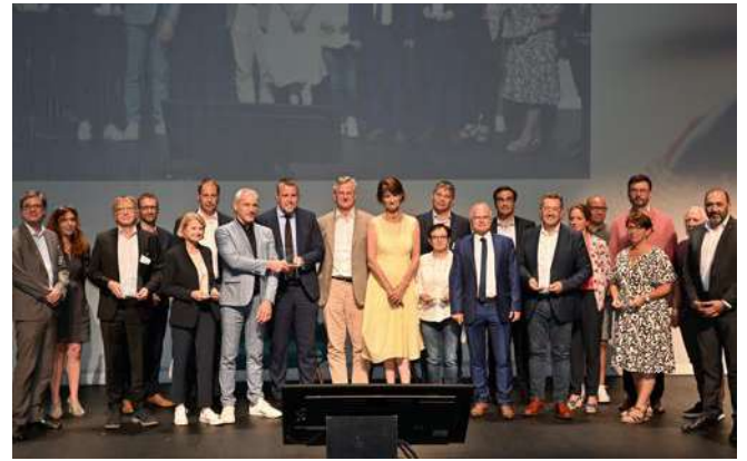
L'édition 2022 des Trophées des maires du Rhône.