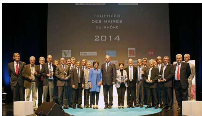
L'édition 2014 des Trophées des maires du Rhône.