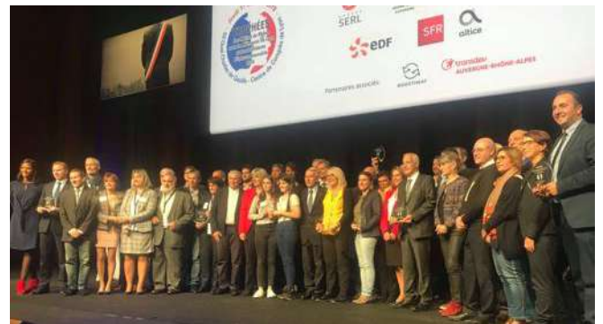
L'édition 2019 des Trophées des maires du Rhône.