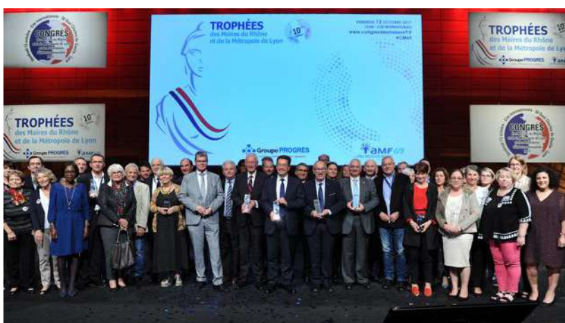
L'édition 2017 des Trophées des maires du Rhône.