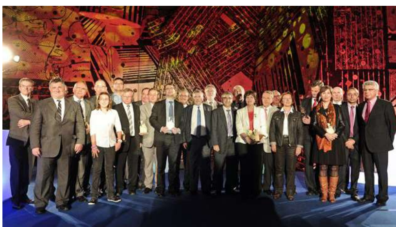
L'édition 2012 des Trophées des maires du Rhône.