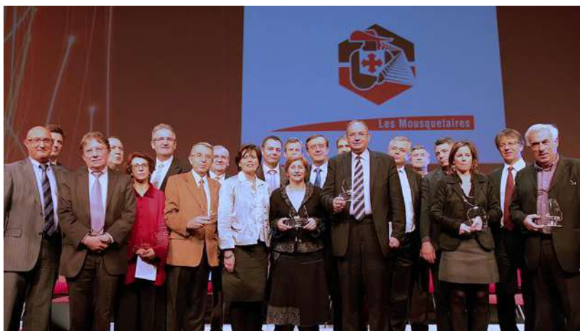
L'édition 2008 des Trophées des maires du Rhône.