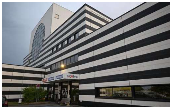
C'est à l'imprimerie du Groupe Ebra du Progrès à Chassieu qu'aura lieu l'édition 2024 des Trophées des maires du Rhône.

Il s'agira de la 15 e édition des Trophées des maires du Rhône cette année du côté de l'imprimerie du groupe Ebra à Chassieu.