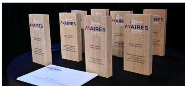
Les trophées de l'édition 2023 des Trophées des maires du Rhône.

- Trophée de l'urbanisme : Ce trophée récompensera une commune ou une intercommunalité pour une réalisation dans le domaine de l'urbanisme