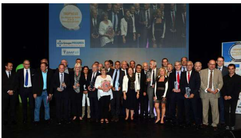
L'édition 2015 des Trophées des maires du Rhône.