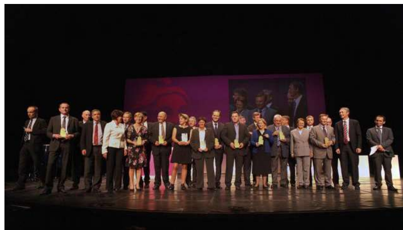
L'édition 2010 des Trophées des maires du Rhône.