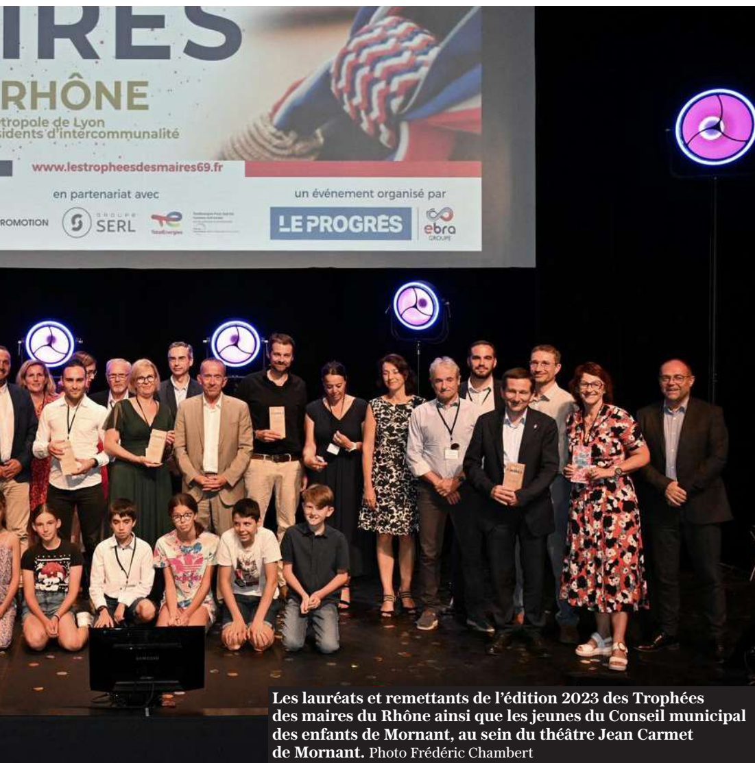
Les lauréats et remettants de l'édition 2023 des Trophées des maires du Rhône ainsi que les jeunes du Conseil municipal des enfants de Mornant, au sein du théâtre Jean Carnet de Mornant.