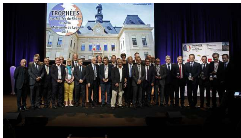
L'édition 2016 des Trophées des maires du Rhône.