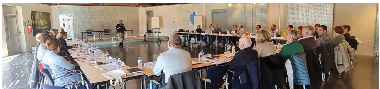
Formation décentralisée au Lac des Sapins à Cublize

Les formations sont axées sur les compétences du bloc communal, le développement personnel pour permettre aux élus de mieux appréhender leur mandat.