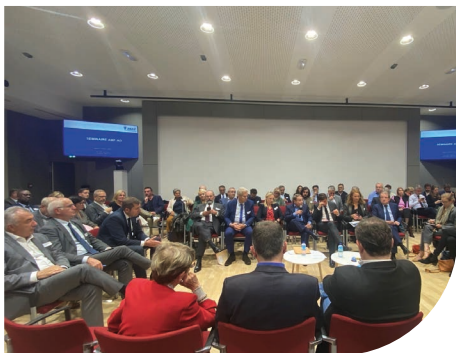
Séminaire à l'AMF à Paris

L'AMF69 est un organisme de formation agréé par le Ministère de l'intérieur.