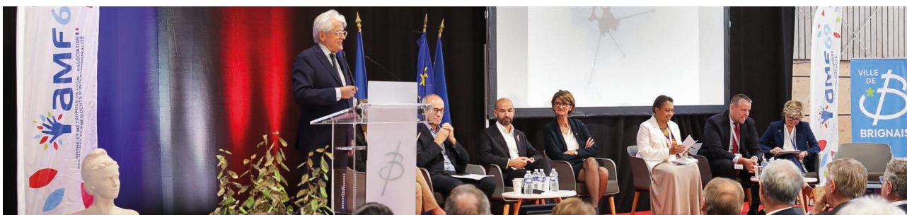
Congrès 2022 avec le politologue Pascal PERRINEAU à Brignais

Notre Congrès départemental annuel, qui réunit plus de 800 élus et 80 partenaires traditionnels des collectivités, est quant à lui devenu un rendez-vous incontournable des élus et des décideurs publics de nos territoires.