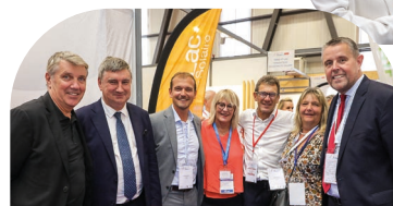
Salon AMF69 2022