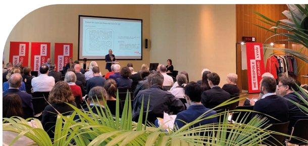
Matinée Les collectivités locales et la coopération internationale. Siège de la Métropole de Lyon

Statutairement l'AMF69 assiste, informe, aide, forme, unit et regroupe ses adhérents.