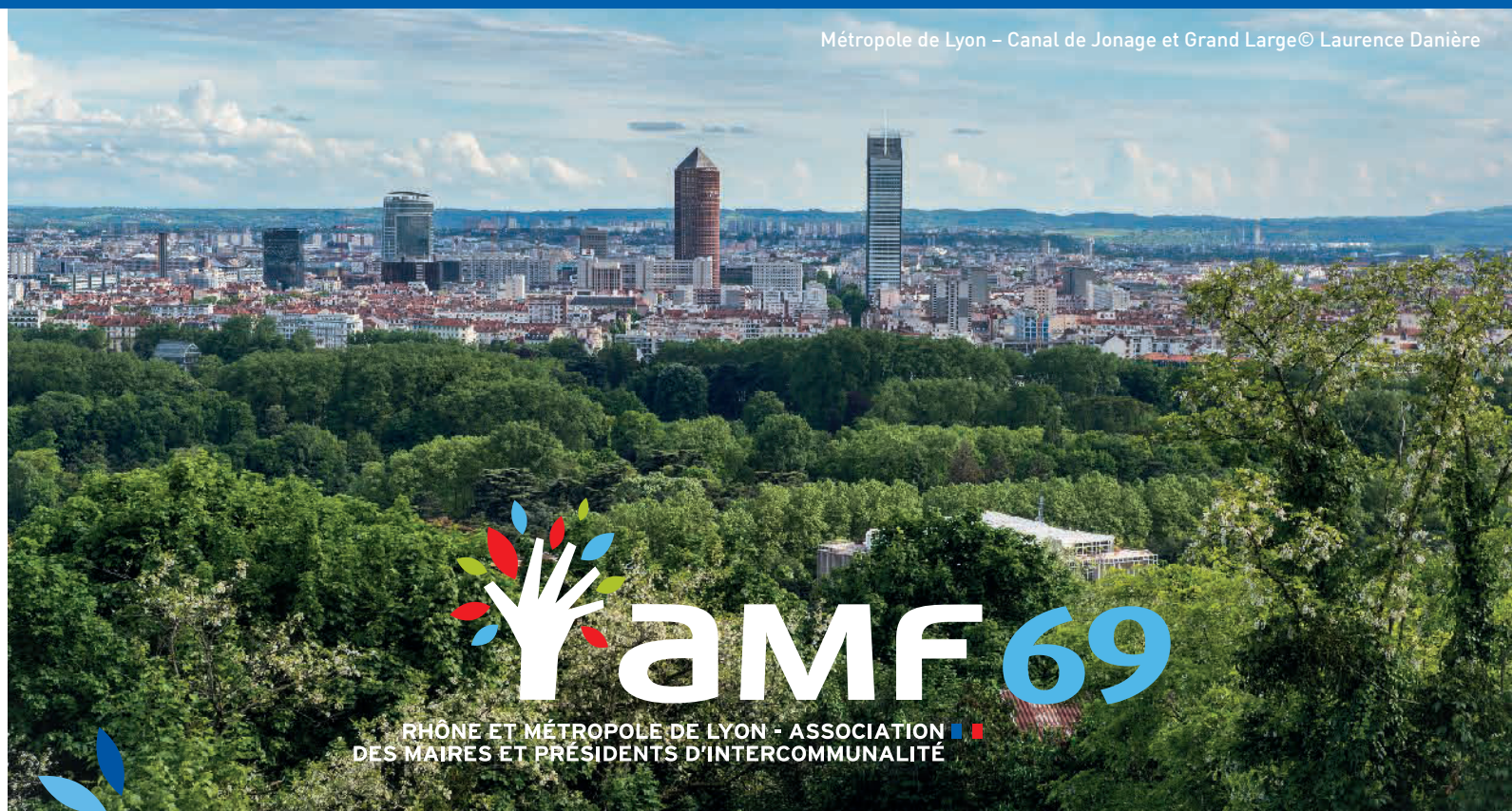
Métropole de Lyon – Canal de Jonage et Grand Large