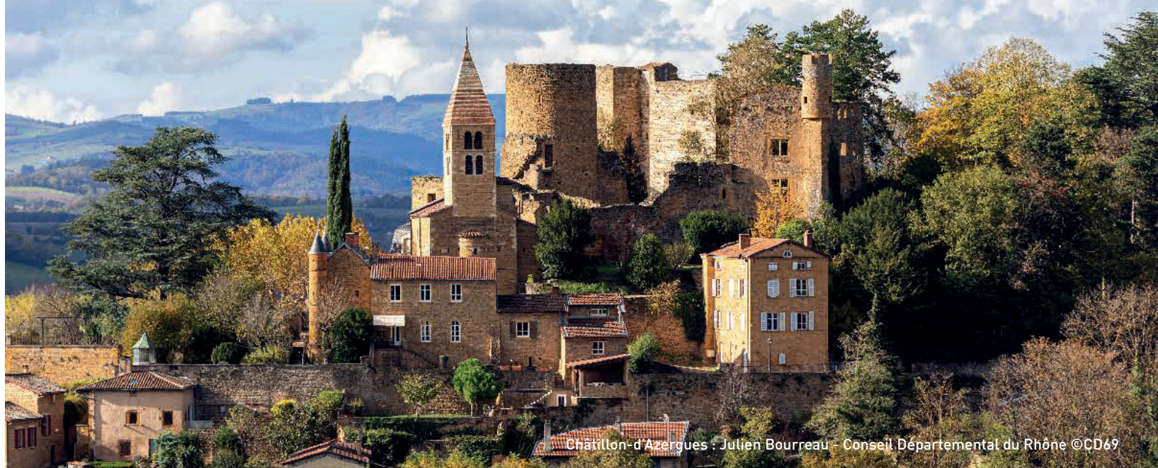
Châtillon-d'Azergues : Julien Bourreau - Conseil Départemental du Rhône ©CD69