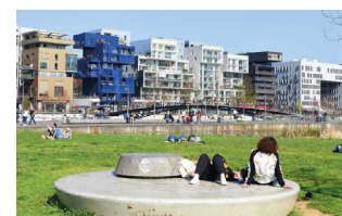
Quartier Confluence Confluence_2

Vous pouvez à tout moment saisir directement notre équipe pour toutes vos questions concernant le statut et les responsabilités de l'élus et, de manière plus générale, pour tout sujet concernant le droit des collectivités.